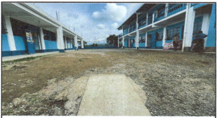
Fotografía 4. Reparación de plancha de concreto de patio.