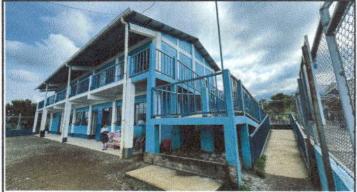
Fotografía 2. Mantenimiento a barandas de metal.