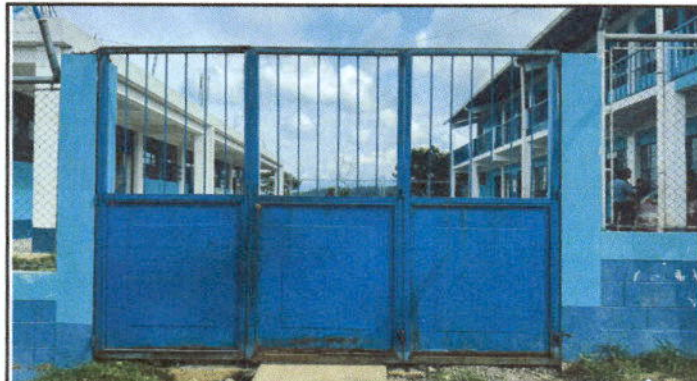
Fotografía 3. Mantenimiento a portones de metal.