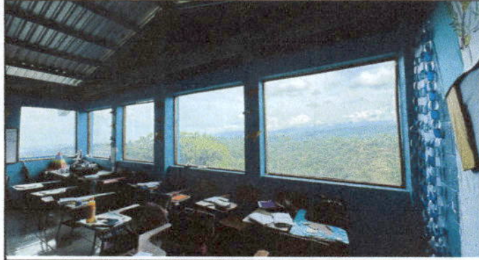
Fotografía 1. Sustitución de ventanas de madera por metal mas vidrio.