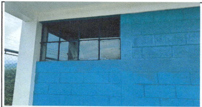
Fotografía 5. Fabricación e instalación de balcones de hierro en ventana